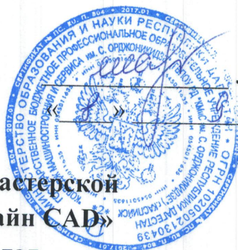
График загрузки мастерской «Инженерный дизайн САД» 2021/2022 уч.год